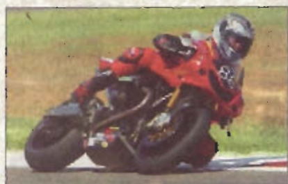
La Moto Guzzi Mgs 01 in azione ad Albacete