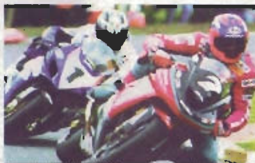
I re della Nw 200 Farquhar e Archibald