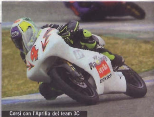
Corsi con l'Aprilia del team 3C

Con la gara di Jerez si è quindi chiuso anche il Cev, che ha laureato campioni nazionali